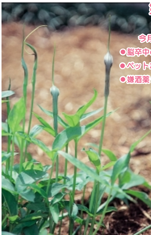
カラスビシャク（サトイモ科）

畑や路傍に生える多年草で、夏に緑、時に暗紫色の総苞に包まれた花茎を伸ばし、蚊が頭を立てたような外観を呈します。地下にある直径2cmほどの球茎を半夏（はんげ）といい、漢方で吐き気止めの重要な生薬です。えぐ味が強くて服み難いですが、生姜、甘草などと一緒に煮るとえぐ味が弱まるとされています。