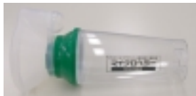
写真2 マイクロヘラーマスク付き

症状によってはスパーサーが適さない場合もあります。詳しい吸入方法などと合わせて、気軽に薬剤師に相談して下さい。