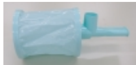
写真1 インスパイアース

マイクロヘラーマスク付きの特徴は、マスクが付いていることです。マスクで鼻と口を覆うことができるので普通の呼吸のように吸入をすることができます。うまく吸入ができないお子様や、吸入を嫌がるお子様に適しています。テレビを見ている間などに吸わせてあげて下さい。